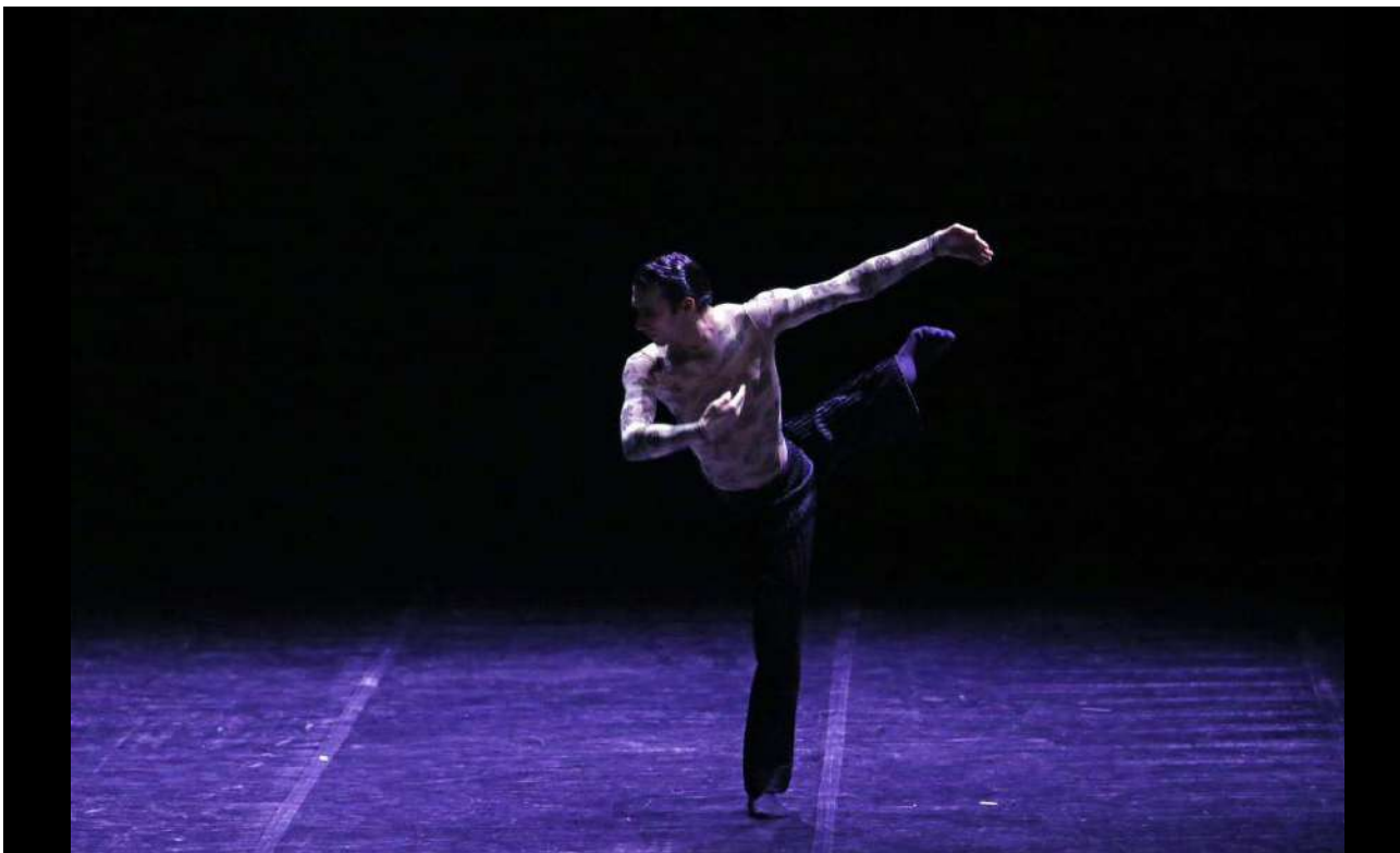
Rosario Guerra